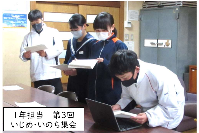
1年担当 第3回 いじめ・いのち集会

2年生教室の近くに学年目標の木があります。「素直に 謙虚に こつこつと」頑張っている2年生が、葉になり花になり実になって、立派に育っています。3学期は、3年生が心を落ち着けて進路実現のための時間を過ごせるようにと、学校生活の中心となって頑張ってくれています。とても頼もしく感じています。